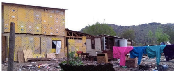
Fotografía: Juan Francisco Echeverría, 2018

Casa de M. B., su esposo y sus tres hijos, recién remodelada al momento de la foto 16 .